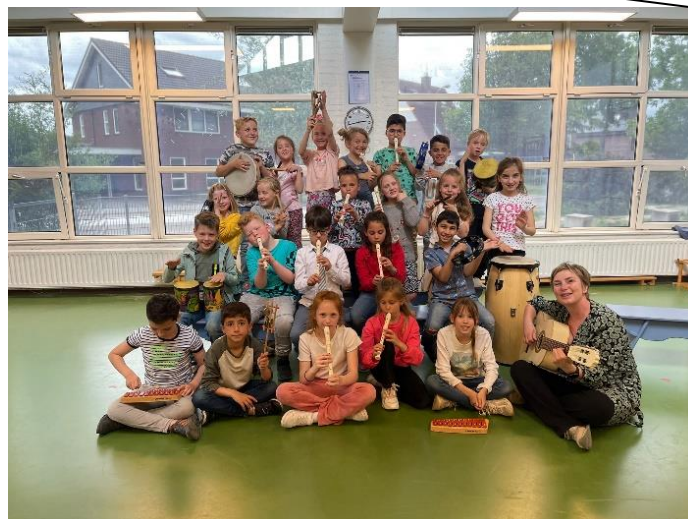
Blokfluitpresentatie groepen 4